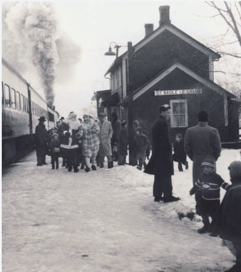
Décembre 1954. Le père Noël arrive en train.

L'identité culturelle, appuyée par ses réalisations, constitue un élément essentiel dans ce projet et dans le développement durable. La mise en œuvre d'une seconde politique culturelle apporte une continuité pour l'ensemble de nos initiatives et permet à la Municipalité de soutenir ses efforts encore en pleine effervescence.