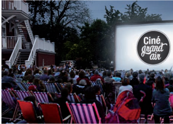
PHOTO Classiques de la gloriette 2014