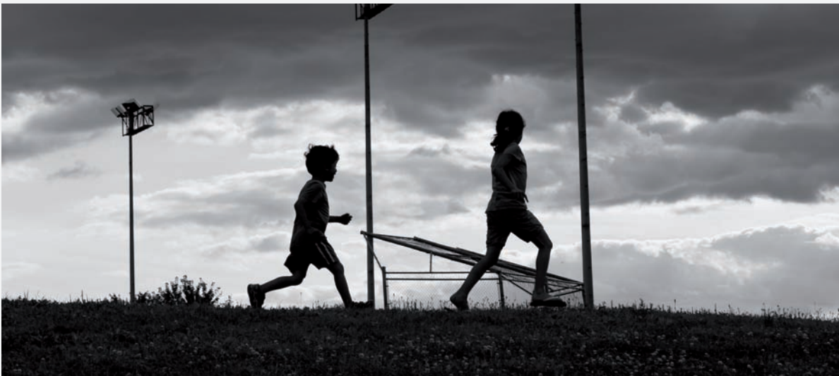
Course ludique Concours Le Grand Zoom 2013-2014

LA MUNICIPALITÉ, EN COLLABORATION AVEC SON COMITÉ DE DÉVELOPPEMENT CULTUREL, SOUHAITE POURSUIVRE SON ENGAGEMENT CULTUREL DANS TOUTES LES FORMES D'EXPRESSION.