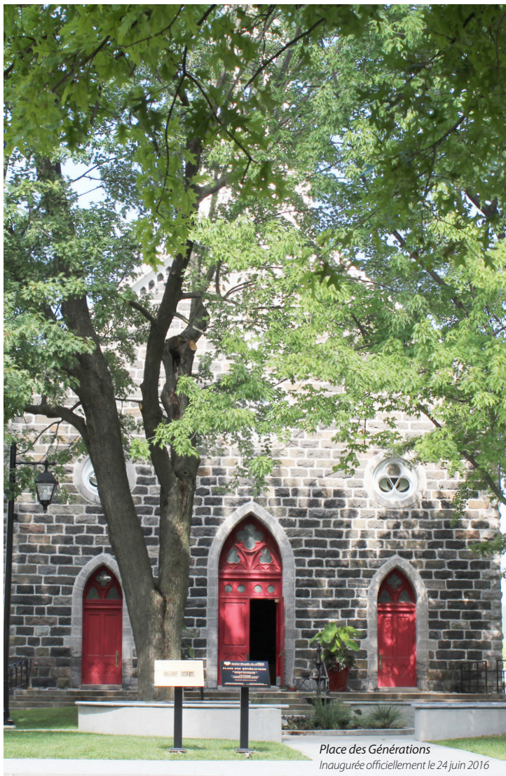
Place des Générations Inaugurée officiellement le 24 juin 2016