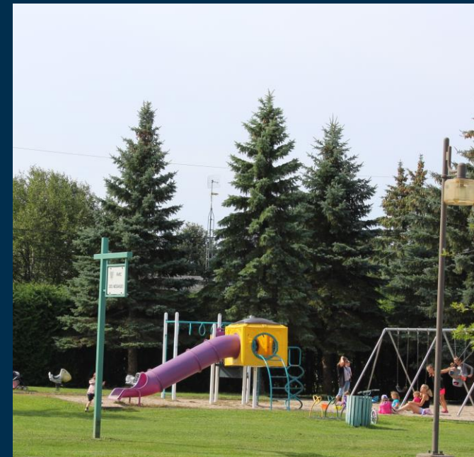
Parc des Mésanges