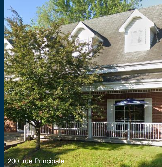
200, rue Principale