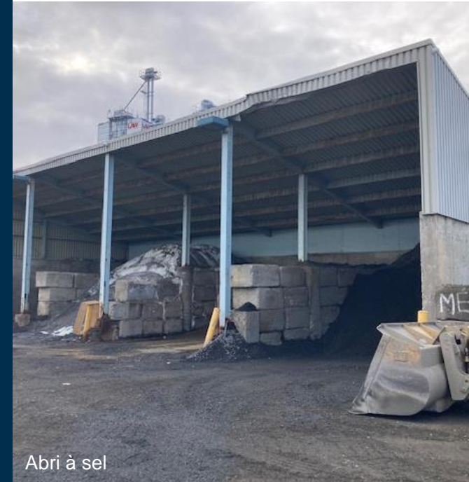
Abri à sel