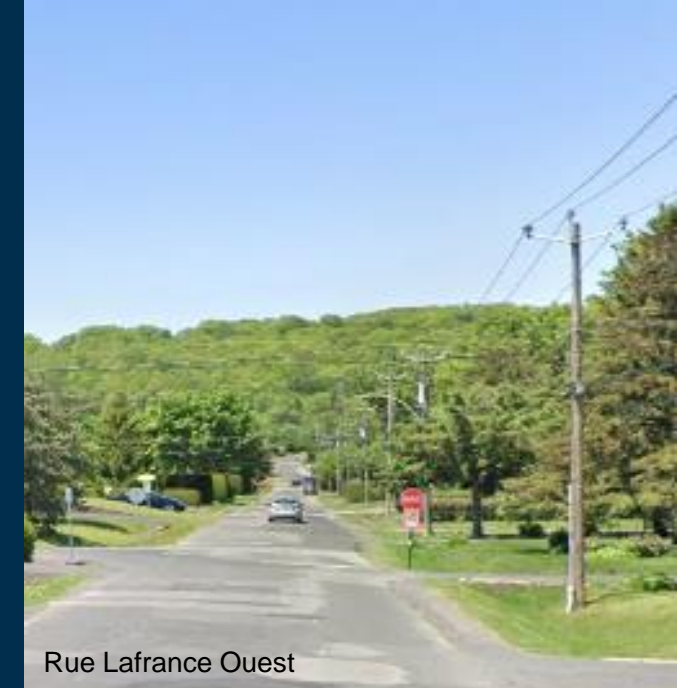
Rue Lafrance Ouest