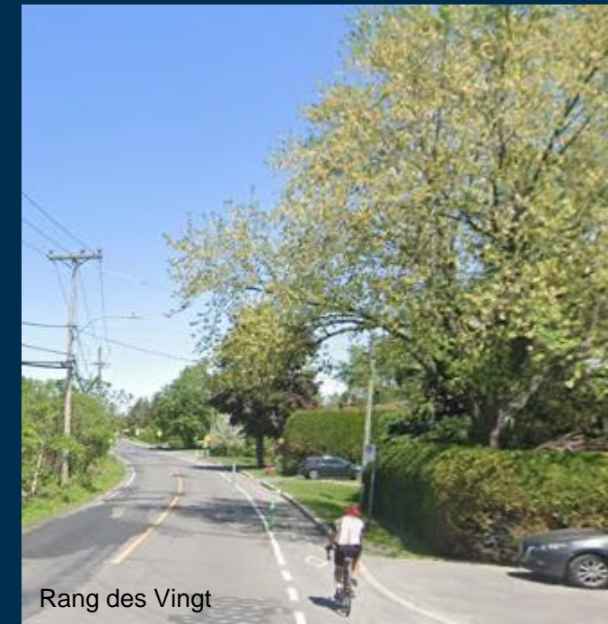
Rang des Vingt