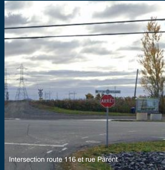
Intersection route 116 et rue Parent